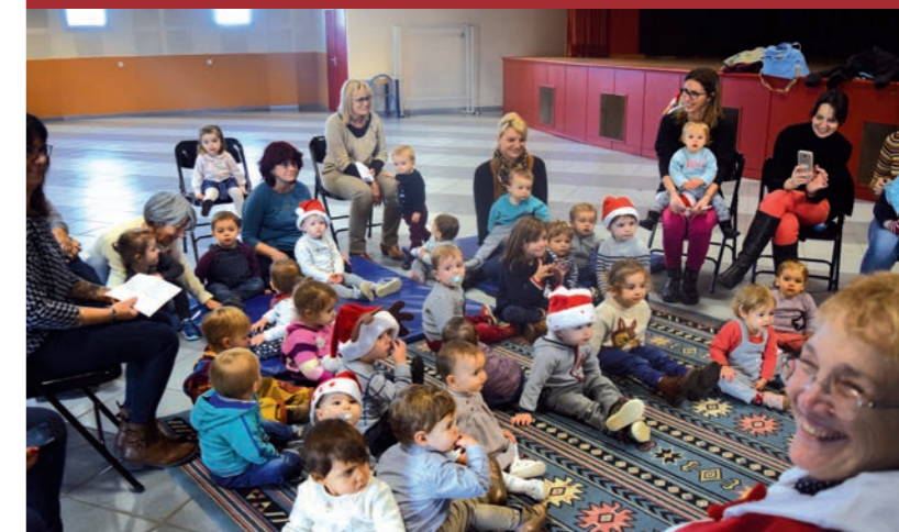
Bercés par la douce voix des mères Noël

Félicitations à tous pour la réussite de ce bon moment.