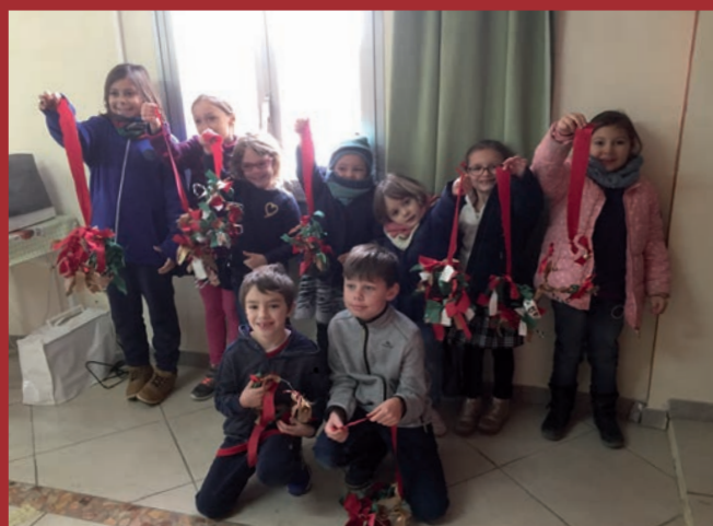
1, 2, 3 : du Soleil plein les cœurs