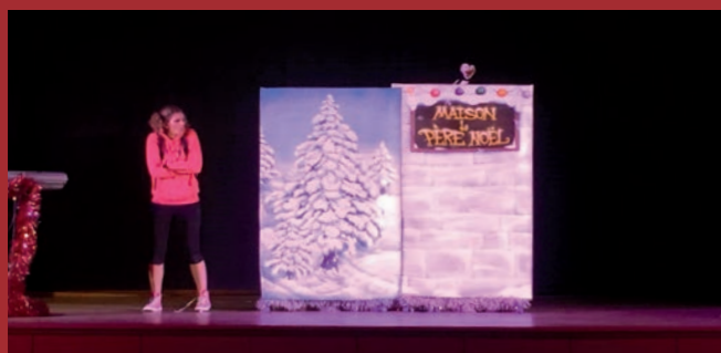
1, 2, 3 : du Soleil plein les têtes

L'équipe 123 Soleil - asso123soleil@laposte.net facebook : 123 soleil Restinclières