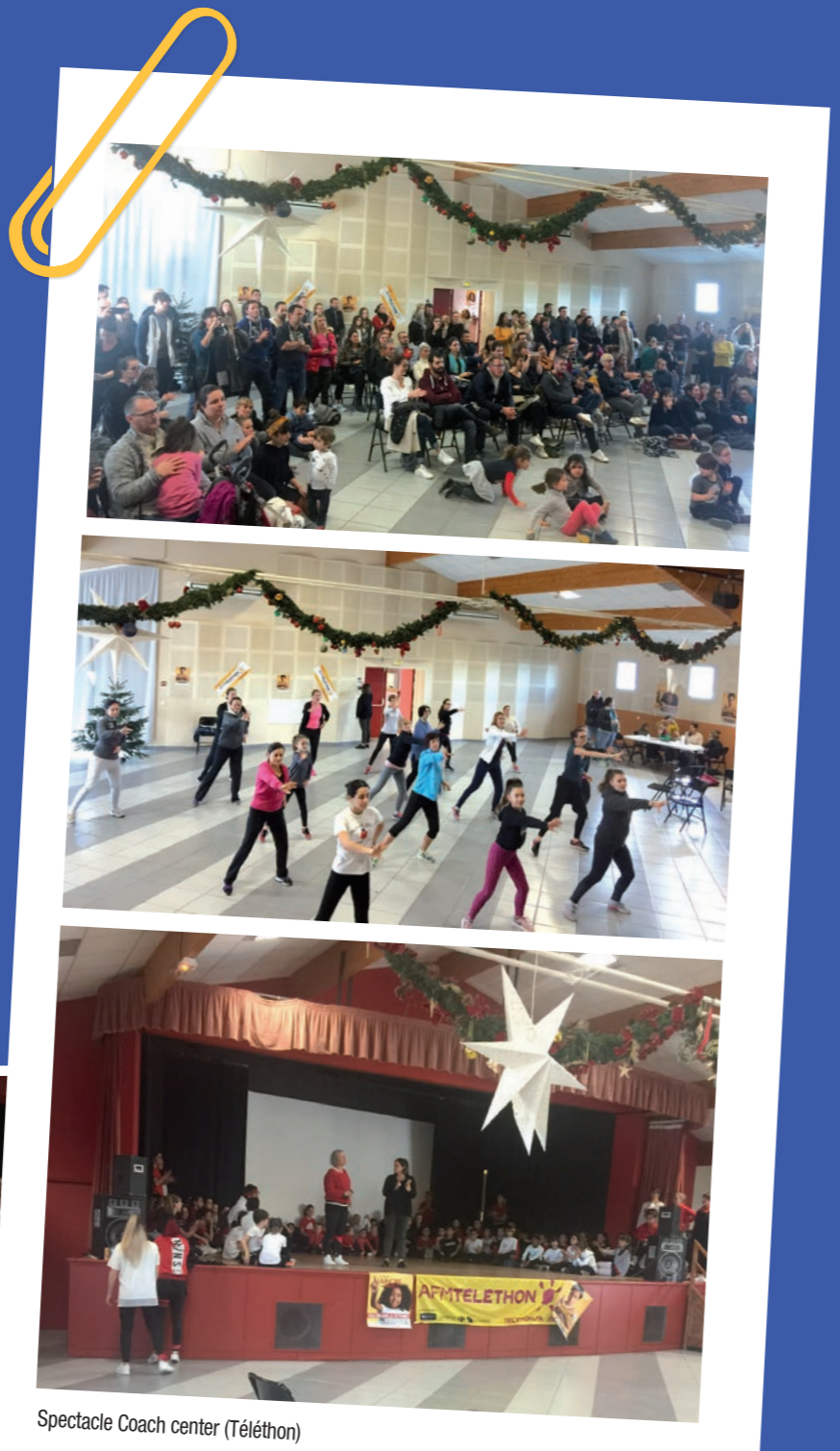
Spectacle Coach center (Téléthon)