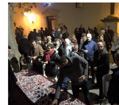
Et le vin chaud remporte toujours un franc succès