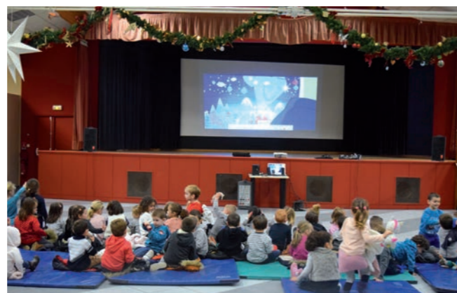
Les plus petits réunis devant le film

Le vendredi 20 décembre a réuni petits et grands à tour de rôle dans la Salle des Arbousiers pour visionner un film de Noël. Au programme, l'Apprenti Père Noël pour les maternelles et Paddington pour les primaires, suivi d'un goûter : brioches offertes par la municipalité. Rire et joie de vivre étaient de mise pour faire régner la magie de Noël. Mais les festivités ne se sont pas arrêtées là ! En effet, lors du service de midi à la cantine, le personnel avait revêtu ses plus beaux déguisements pour enchanter les enfants. La journée s'est achevée par la venue de l'équipe de l'APE les Petits Rasclets qui a offert vin chaud et chocolat chaud aux parents pour clore cette année 2019.