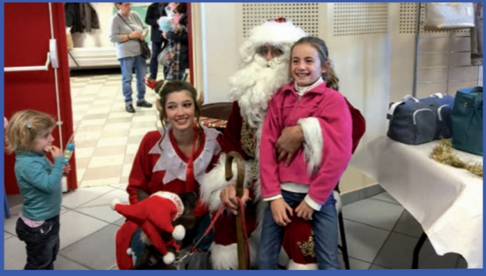
Visite du Père Noël au marché de Noël