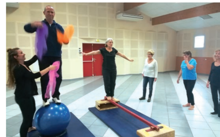
Les Rastings en équilibre !