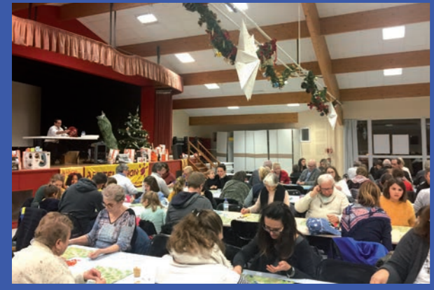
Loto du Téléthon