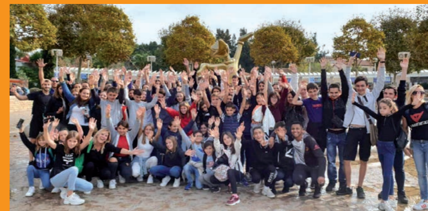
Jeunesse restincliénoise et de beaulieuoise prêtes pour l'Aventura

L'équipe accompagnante remercie l'ensemble des jeunes, l'organisateur ainsi que le chauffeur du bus qui ont tous contribué au bon déroulement de ce séjour. Nous vous donnons rendez-vous du 17 au 21 février pour la prochaine sortie jeunesse... le séjour ski à la montagne !