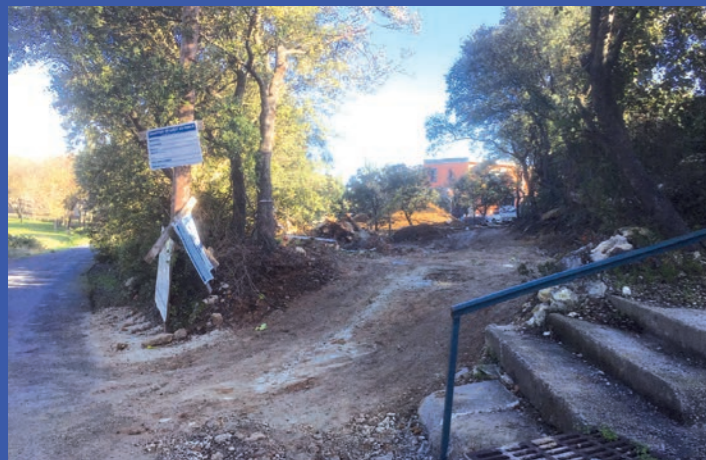
L'impasse du Berger menait à l'ancienne bergerie Brajon