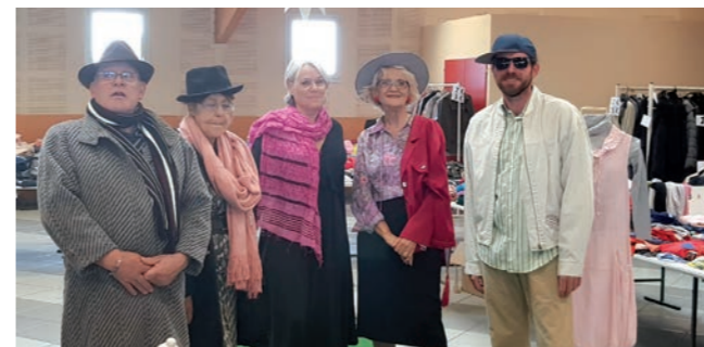
Un défilé de stars