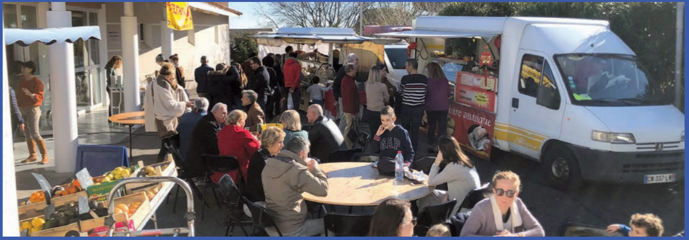
Marché dominical au Marché de Noël