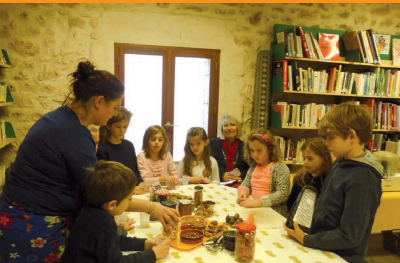
Regards croisés : l'arbre fruitier