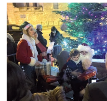
... accompagné de son lutin !