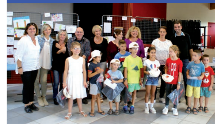
La jeunesse artistique restincliéroise

Nous vous donnons rendez vous en 2020 avec une nouvelle formule - plus de détails à venir... À suivre.