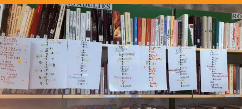
Atelier : « écritures »