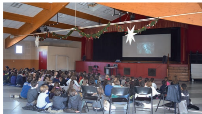
Les primaires attentifs à M. Paddington