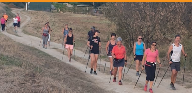
Marche nordique - A chacun son rythme