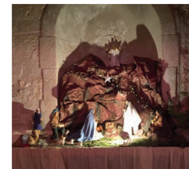
L'église ouvre ses portes à la visite de sa crèche