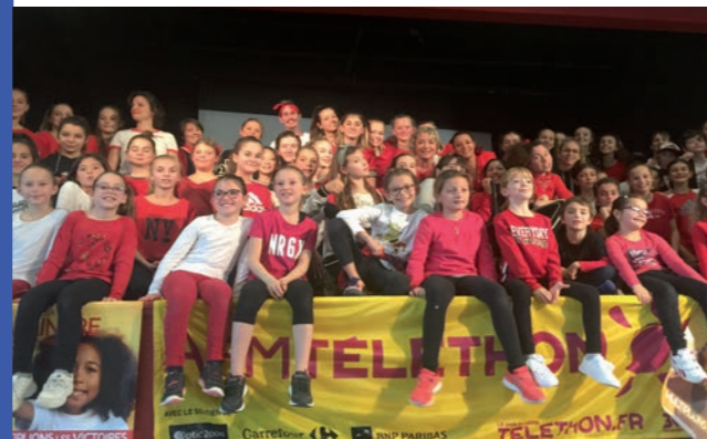
Les petits rats du Téléthon