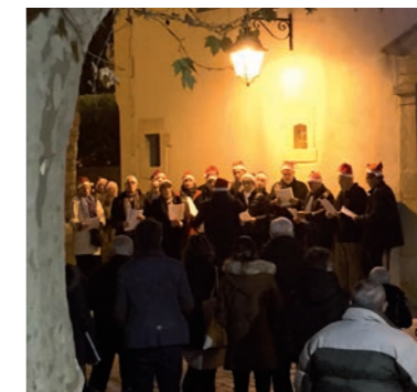
Les petits chanteurs à la Croix Occitane !