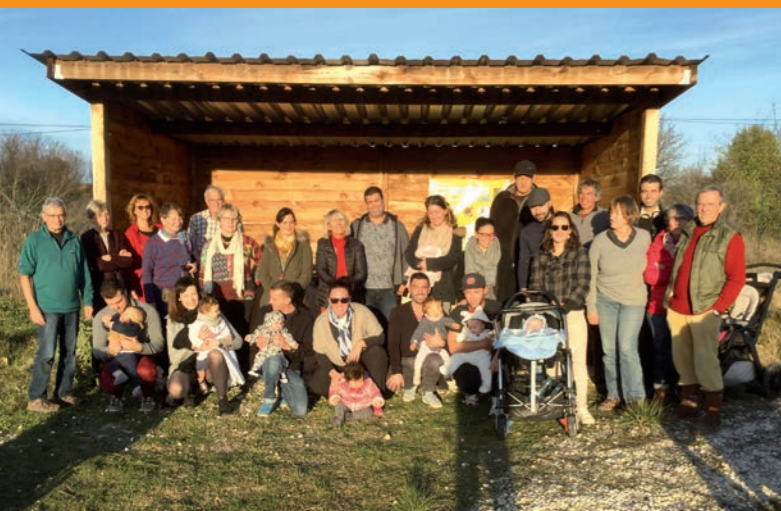
Une naissance – un arbre

Pour plus d'informations sur nos activités passées ou à venir, rendez-vous sur notre site régulièrement mis à jour https://arbre34160.org