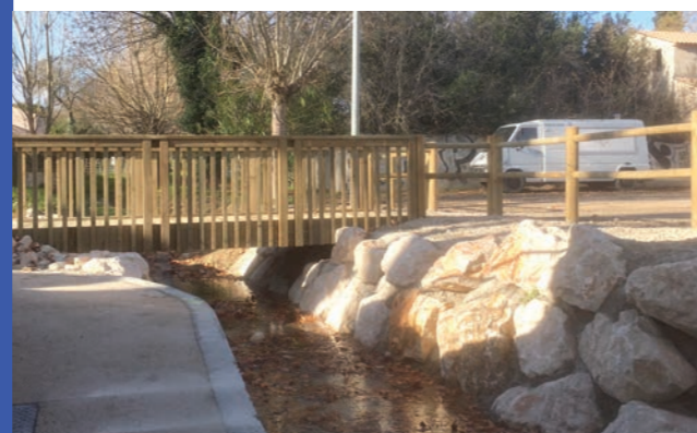
Les saisons passent, le village s'embellit