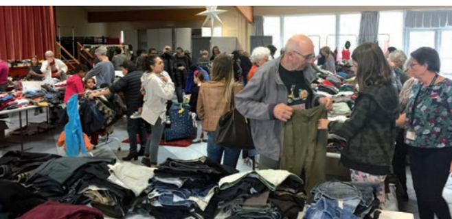
On flairer les bonnes affaires...