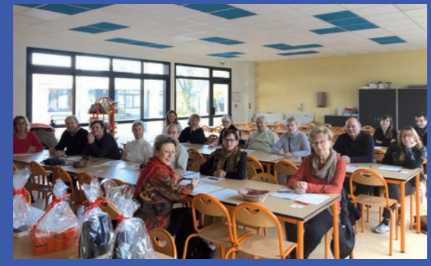
Dictée des grands !