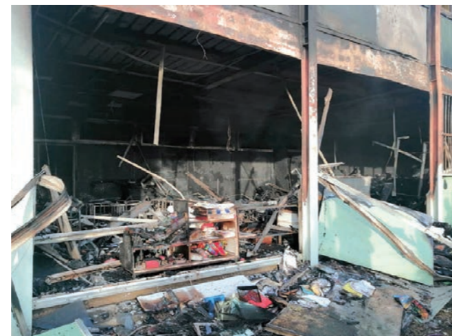
Le drame criminel des Tamaris

Suite à l'incendie qui a ravagé l'entièreté de l'école des Tamaris à Béziers, la commune de Restinclières a offert à la mairie de Béziers plus 60 chaises et 8 tables de cantine en bon état (suite au réaménagement des travaux d'extension du Groupe scolaire), afin de remédier, dans une certaine mesure, au matériel envolé en fumée.