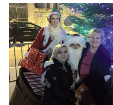
Bizard ! Vous avez dit Bizard ?