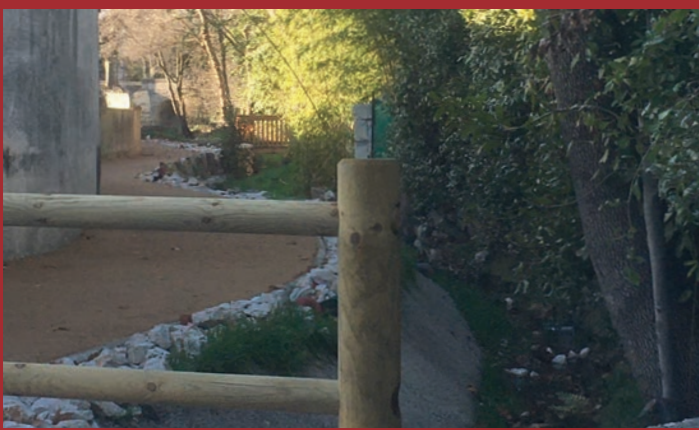
Utile et agréable... pour une gestion accrue des eaux pluviales