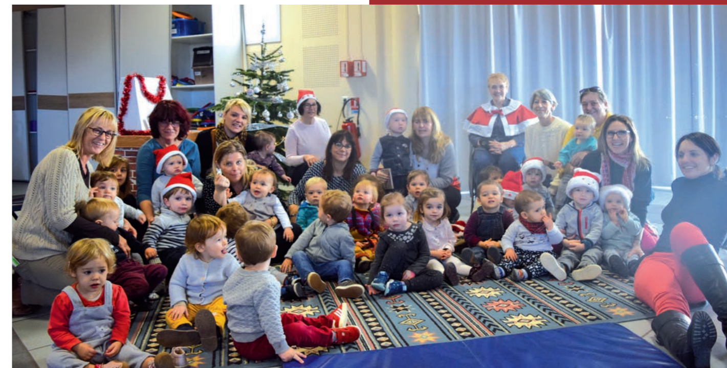
Des paillettes plein les yeux