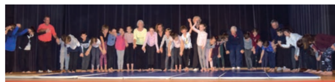
Les enfants et Les Rastings, ensemble

Écrit par les élèves de la classe de CM2.