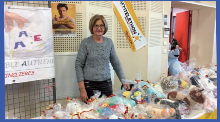
Marché de Noël, stand AEA