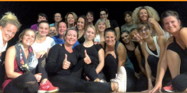
Coach Center - Un stage réussi