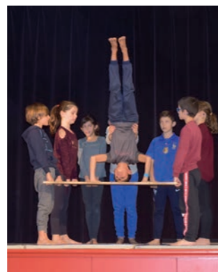
Représentation des enfants

Ce temps autour du cirque, offert par la Métropole, a eu pour objectif de permettre aux enfants du groupe scolaire, ainsi qu'à l'association Les Rastings de profiter de cours d'initiation au cirque, dont la mise en commun intergénérationnelle des talents a livré un résultat épatant !