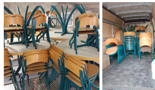
Les équipements de notre ancien réfectoire En route pour une nouvelle vie aux Tamaris