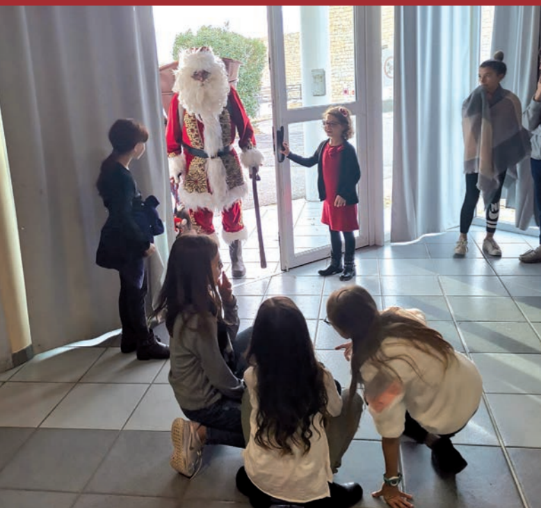
Arrivée du Père Noël