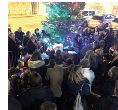
Pour la distribution des cadeaux, le Père Noël prend place...