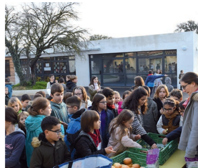
La fameuse distribution des brioches