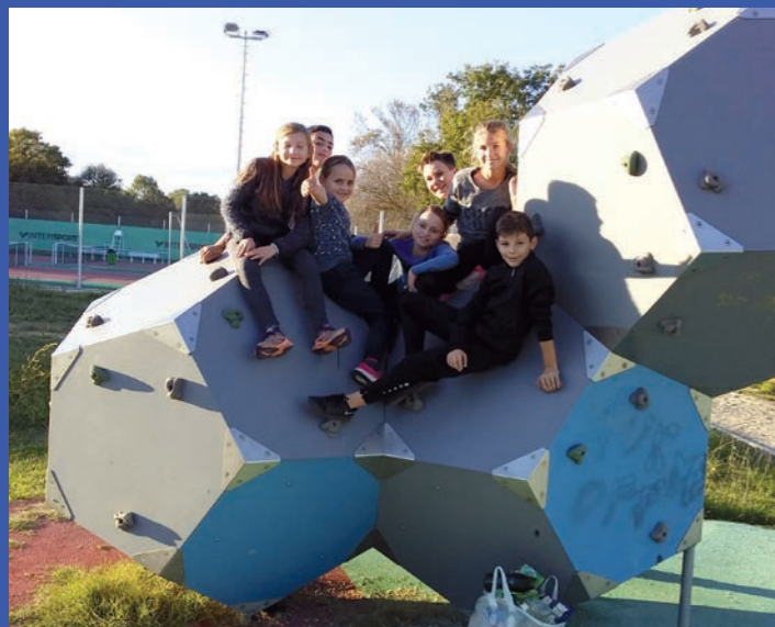
Une équipe spontanée de jeunes responsables.