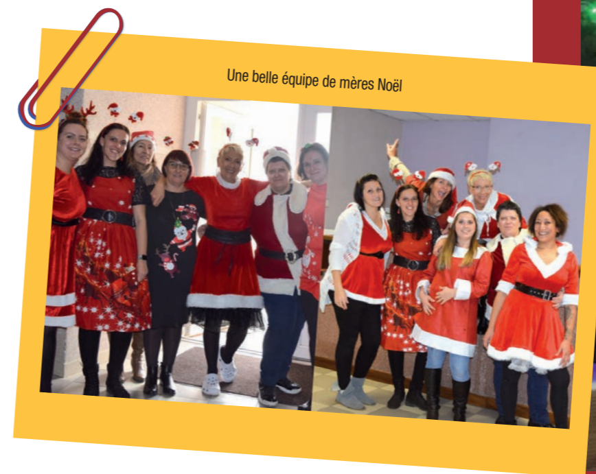
Une belle équipe de mères Noël