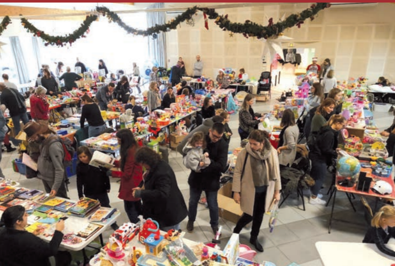
Bourse aux jouets