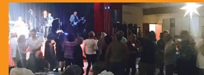
Ça swing à Restinclières

Nous vous donnons rendez-vous en 2020 pour une nouvelle édition.