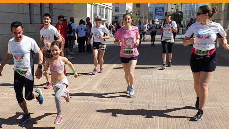
Courir tranquille - Petits et grands à grandes foulées