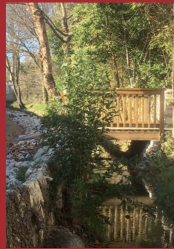
Un cheminement qui relie les restincliérois Une promenade bucolique