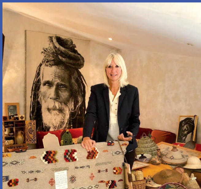
La Casa de Pascale, une affaire qui roule