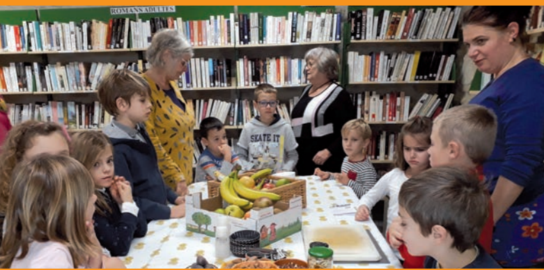
Atelier : « l'arbre fruitier »