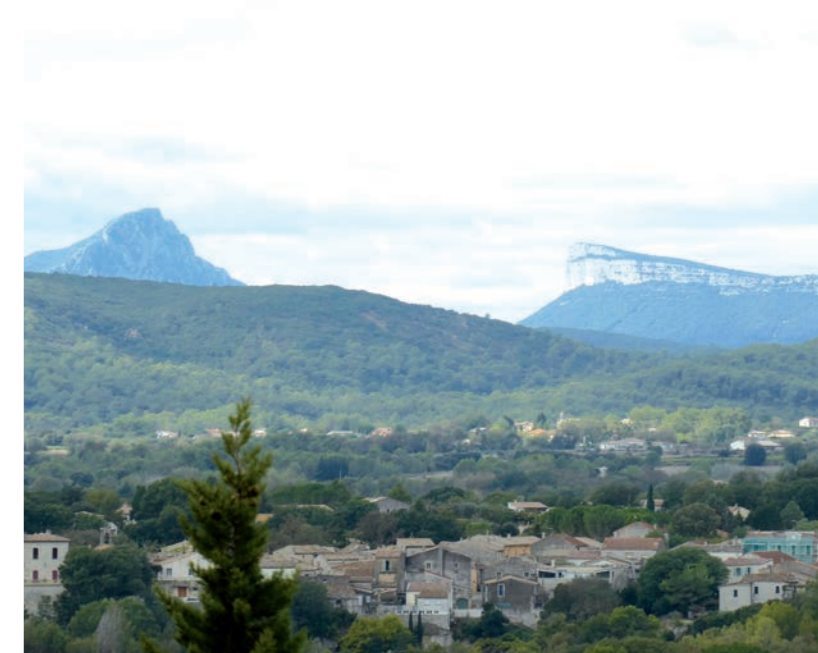
Une bouffée d'air frais

Séance découverte offerte. Inscription possible toute l'année.