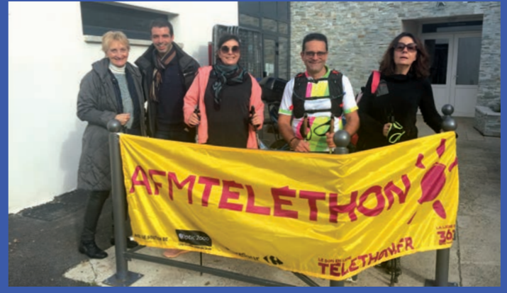
Marche nordique pour le Téléthon